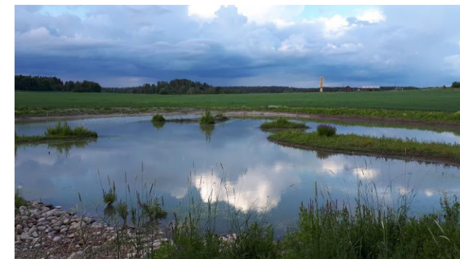
Koivulan kosteikko heinäkuussa 2019.

Ota yhteyttä yhdistyksen hallituksen jäseniin ( www.hormajarvi.fi/ yhteystiedot) tai suoraan: anstiheiskanen@gmail.com , puh. 0440 586114