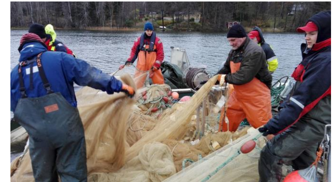
Hoitokalastusta Hormajärvellä marraskuussa 2017

Yhdistyksen talkooporukka on hoitokalastanut Hormajärvellä vuodesta 2006 alkaen. Keväisellä rysäpyynnillä sekä ajoittain myös syys- ja talvinuottauksilla on pyritty vähentämään särkikalakantaa. Hoitokalastus edesauttaa järven ekosysteemiä toipumaan rehevöitymisen kierteestä. Vuosina 2006-2011 kalaa poistettiin keskimäärin 14 kg hehtaarilta vuodessa. Viime vuosina saaliit ovat laskeneet alle 2 kg/ha, joten hoitokalastuksessa pidetään nyt taukoa.