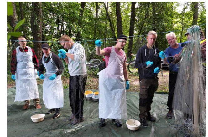
Verkkokoekalastuksen saaliin käsittelyä elokuussa 2021 Hormajärvellä.

Hankkeesta ja sen tuloksista saatavilla lisätietoa https://www.luvy.fi/hankkeet/hormajarven-kunnostus/ sekä www.hormajarvi.fi (osastosta 'Hoito- ja kunnostus').