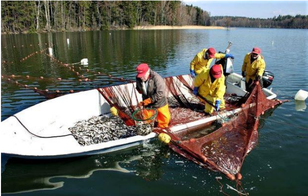
Hoitokalastusta rysäpyynnillä Hormajärvellä.

Hoitokalastuksen vaikutuksia järven kalakannan rakenteeseen selvitettiin verkkokoekalastuksella keuhalla 2020. Kalakanta on edelleen särkikalavaltainen. Tuloksista lisätietoa www.hormajarvi.fi sivulta 'Hoito ja kunnostus'