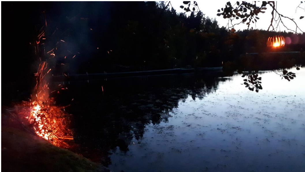
Kuva: Elokuun merkkitulet Suomen luonnon päivänä 31.8.2019