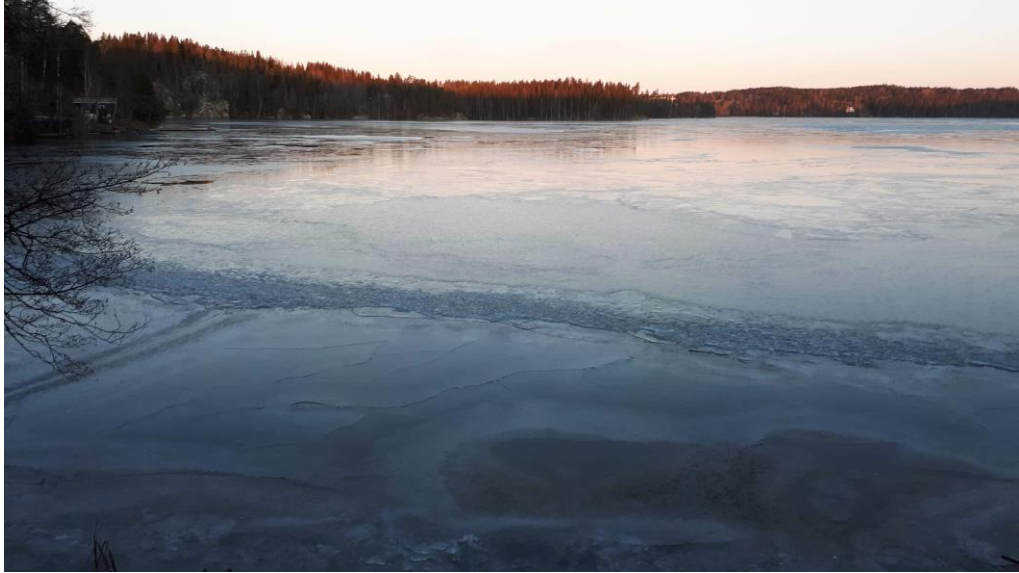
Kuva: Hormajärven läntinen allas jäätyi hetkeksi helmikuussa 2020

Talvella 2019-2020 Etelä-Suomessa lunta ei juuri ollut, lämpötilat olivat normaalia korkeammat, sateisuus suurempi ja järvien vedenkorkeudet olivat tulvalukemissa. Hormajärvelle ei tullut pitkäaikaista ja liikkumista kestävästä jääpeitettä, jonka takia läntisen altaan syvänteiden hapettimia ei ollut tarpeen käynnistää koko talvena. Talven ja koko kevään 2020 hapettimet ovat olleet pysähdyksissä. Hapettimet käynnistetään tarvittaessa loppukesällä 2020, mikäli mittaukset osoittavat sen tarpeelliseksi.